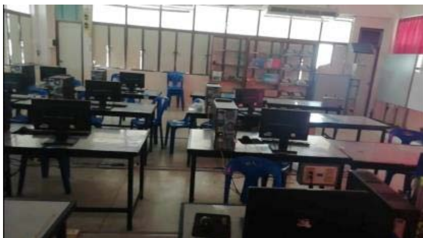
ตอนทำความสะอาด