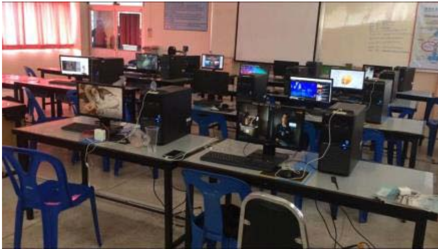
ก่อนดำเนินโครงการ